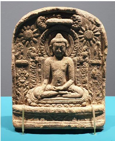
도 13. 봉헌판, 뿌시대, 스리 크세트라 고고학박물관

뿌 시대 6세기의 봉헌판이 지닌 또 다른 특징은 중앙의 불상이 크다는 점과 축지인 이외의 수인(手印)을 한 경우가 많다는 것이다. 심지어 스투파 대신 두 개의 태양을 불상의 두부 양 옆에 나타내는가 하면, 불상의 대좌에 등받이가 있는 굽타식 의자형 조형을 보여주기도 한다(도 13). 봉헌판의 불상은 어깨가 넓고 허리가 가늘며 배꼽이 분명하게 보인다. 불상의 신체가 다른 조형물보다 높