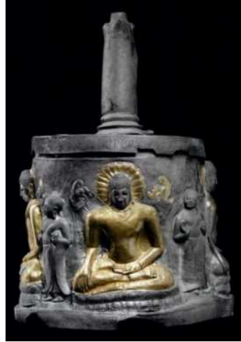
도 4. 석판, 뿌시대, 깃바 출토, 스리 크세 트라 고고학박물관(Guy 2014, 79).