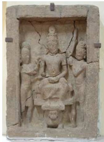
도 7. 테라코타 부조상. 불교 시대. 깬바 출토. 스리 크세트라 고고학박물관.

깬바 마운드에서 은제 사리함을 포함한 유물과 함께 테라코타 부조상도 출토되었다(도 7). 인도, 티벳, 동남아 각지에서 발견되는 봉헌판(votive tablet)처럼 생긴 이 부조는 탑의 동남쪽 부분에서 발굴되었는데, 여러 조각으로 깨진 것을 맞춰서 복원한 것이다. 액자처럼 생긴 사각 틀 안에 의자에 앉은 모습의 의좌상(倚坐像)과 좌우 협시가 묘사되었다. 1930년에 드루와젤이 처음 깬바 유물을 발굴하고, 그에 관한 연구를 출판했을 때, 그는 이 조각의 도상을 무