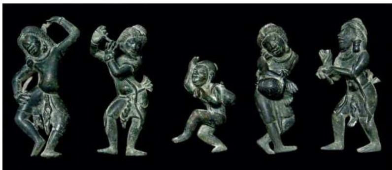
도 1. 청동 인물상, 6-7C, 양곤 국립박물관(Guy 2014, 64).

건의 기사가 나오는데, 35명의 악공과 함께 뽀의 마하라자(Maha Raja)인 용창(Yungchyang)이 당시 슈리(Śri)를 다스리고 있었던 자신의 동생 슈난토(Shunanto)를 사신으로 보냈다는 내용이다. 슈리는 스리 크세트라로 추정된다. 이 시기에는 뽀를 그대로 음역하여 “표국(驃國)”이라고 지칭했는데, 당시 표국의 속국이 18개였다고 기록한 것으로 미뤄볼 때, 당시의 표국은 아마도 부족국가 형태의 국가 연합이었던 것으로 보인다. 이 기사에는 표국의 악공과 음악, 무용에 대한 찬사와 감탄이 보인다. 당에서 좀처럼 보기 힘든 신기한 가무였던 것으로 보인다 (Kang Heejung 2015). 9) 실제 무용과 음악 연주를 볼 수는 없지만 “표국의 무용”이 어땠는지를 짐작할 수 있는 유물이 있다. 스리 크세트라의 3대탑 가운데 하나인 파야마(Payama) 스투파와 근처에서 발굴된 5기의 소형 청동인물상이다(도 1). 10) 높이가 11cm에 불과한 이 소형인물상들은 저마다 다른 자세로 악기를 연주하며 춤을 추고 있다. 상반신은 나형이고, 짧은 치마를 입었으며 목걸이와 귀걸이 등의 장신구를 했다.