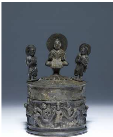
도 6. 카니쉬카 사리함, 2세기, 인도, 영국박물관

있다. 이러한 교역로를 통해 원통형 몸체의 깃바 사리함과 같은 조각도 가능했으리라고 추정할 수 있다. 이 사리함은 조각의 양식적인 면이나 도상 등에서 분명히 인도, 특히 굽타시대 안드라 프라데시 지역 미술의 영향을 받았을 것으로 보고 있다. 하지만 인도에는 현재 굽타시대 이후의 원통형 조각과 유사한 선행예가 없다는 점에 유의할 필요가 있다. 원통형의 사리함은 인도에서 비마란 사리기나 카니쉬카 사리기까지 기원이 올라가지만