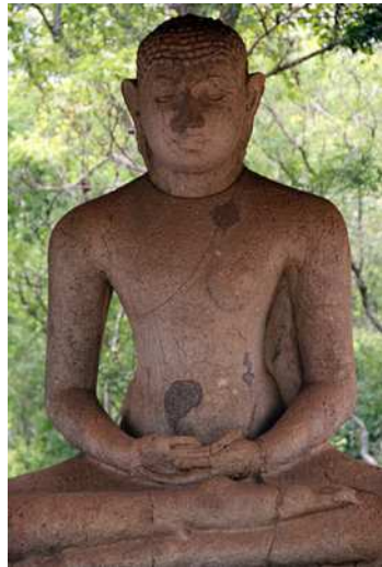
도 10. 불좌상, 6C, 아바야기리, 스리랑카

이 불상은 균형 잡힌 신체에 어깨가 넓고, 허리가 가늘며 팔다리가 날씬하다. 두 다리의 폭은 넓어서 안정감 있는 좌세를 보여주지만 다리가 매우 빈약한 점은 앞에서 본 깎바 출토 불상과 같다. 가는 다리에 비해 두 손과 발을 두툼하게 처리한 점이 이채롭다. 편단우견(偏袒右肩)으로 법의를 입었는데 옷 주름은 표현되지 않았고 마투라나 사르나트의 불상처럼 허리에 띠를 묶은 줄이 표현되었다. 이 불상은 흔히 스리랑카의 불상과 양식적으로 비교되며, 그 근거는 신체 비례와 두 다리를 편안하게 둔 앉음새, 편단우견 법의와 선정인이다. 그에 따르면 이 사암제 불상은 편단우견 불좌상 유형이 스리랑카를 통해 미얀마로 유입되었음을 시사한다고 한다(Guy 2014). 하지만 쁘족의 불상이 스리랑카의 영향을 받아 제작되었다고 단정하는 것은 지나친 일반화이다. 사르나트의 불상처럼 표면을 매끈하게 다듬어 마연한 흔적이 아직 남아있을 뿐만 아니라 불상을 조각한 방식도 사르나트의 조각과 같다. 사르나트의 설법인 불좌상처럼 좌상을 조각하기에는 폭이 좁은 석재를 사용한 까닭에 앉아있는 무릎과 둔부보다 신체 상부를 약간 위로 세워 조각하는 방식을 통해 정면에서 볼 때의 신체 균형을 맞추려고 했다(도 10).