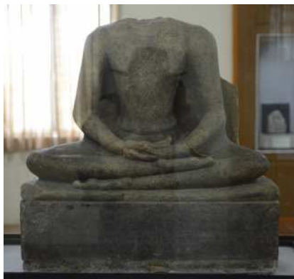
도 9. 석조불좌상, 뽀시대, 스리 크세트라 고고학박물관.

좌 형식, 얼굴 묘사에서 큰 차이를 보인다. 미얀마 중부와 캄보디아, 베트남의 불교문화 교류의 가능성이 매우 적다는 것을 시사한다.