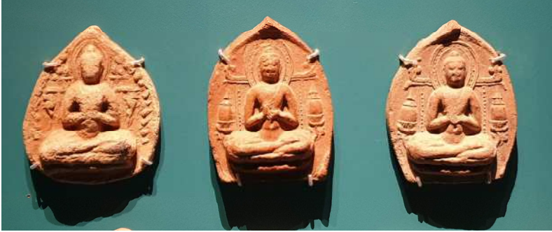
도 12. 봉헌판, 뿌시대, 스리 크세트라 고고학박물관

리 크세트라에서 발굴된 봉헌판에도 역시 중앙에 불좌상이 있고 좌우에 2기의 스투파가 있는데 중앙의 복발(覆鉢) 부분이 아래가 좁고 길쭉한 원통형으로 스투파의 형태가 마치 보보지 탑처럼 높게 표현되었다(도 12). 뿌족의 스투파 모습을 그대로 따라서 새긴 것은 미얀마, 특히 뿌 시대 봉헌판이 가지고 있는 특징이다.