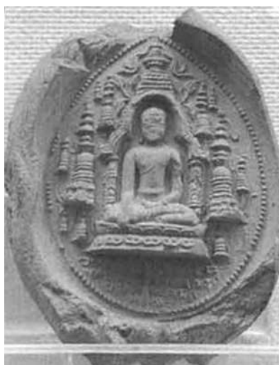
도 11. 봉헌판, 7C, 보드가야 발견, 인도, 보드가야 박물관

불교가 전해지고 얼마 되지 않아서 미얀마에서도 바로 봉헌판을 만들었던 것으로 추측된다. 뷁 시대의 유적에서 벽돌을 이용해 스투파를 건설하거나 건물을 세웠던 것에서도 알 수 있듯이, 진흙을 이용해 불교 건축과 각종 불교 조형물들을 만드는 방식은 일찍부터 인도에서 전해졌다. 현재 남아있는 봉헌판 가운데 압도적 다수를 차지하는 것은 바간 시대의 예들이지만, 뷁 시대나 몬 시대의 유적에서도 적지 않은 봉헌판들이 발견되고 있어서 이목을 끈다. 미얀마의 고대 봉헌판들은 인도, 특히 보드가야(Bodhgaya)의 마하보디(Maha Bodhi) 사원에서 발굴된 봉헌판과 유사성이 많지만, 차이점도 보인다. 우선 보드가야에서 발견된 봉헌판 가운데 불상이 표현된 예들은 거의 대부분 중앙의 향마촉지인(降魔觸地印) 불좌상이 있고 그 좌우에 열반을 상징하는 스투파가 묘사되어 있다(도 11). 스투파들은 전형적인 모습으로 상륜(相輪)이 높이 솟은 첨탑형으로 초기에는 2기, 나중에는 여러 기가 한꺼번에 나타난다. 스