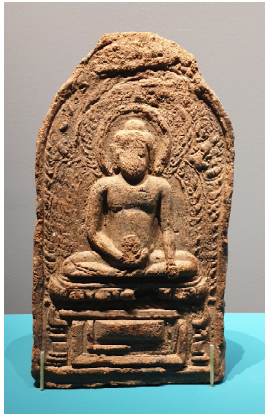
도 14. 봉헌판, 8세기, 스리 크세트라 고고학박물관

7세기 이후 뷁족의 봉헌판은 달라지기 시작했다. 우선 질적으로 흙의 상태가 거칠어서 표면에 그 흔적이 다 드러난다. 전반적으로 크기가 큰 예가 늘어나고 윗부분을 둥글게 다듬은 사각형의 봉헌판이 늘어난다. 역시 스리 크세트라에서 2001년에 수습된 이 봉헌판은 7세기부터 8세기에 걸쳐 제작된 예들이다(도 14). 탑은 보이지 않고 대좌와 광배를 갖춘 편단우견의 불좌상이 낮게 새겨진 전불 형태이다. 16) 육계는 높아졌고 나발은 이 시기의 다른 불상처럼 작아졌으며 얼굴은 평면적이고 신체 또한 양감