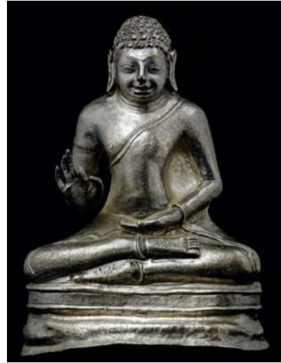
도 8. 은제불상, 6C, 깬바 출토, 양곤국립박물관 (Guy 2014, 84).

다. 오른손으로 여원인을 했고 왼손은 다리 위에 올려 활짝 뜬 눈과 함께 인도 마투라 불상의 오랜 전통을 그대로 따르고 있음을 보여 준다. 착의법과 양식적인 특징은 다르지만 나발 표현법, 눈동자가 묘사된 눈, 손바닥의 법륜(法輪), 상체보다 빈약한 다리에서 양자간의 유사성을 찾을 수 있다. 그러나 동그란 얼굴, 편단우견의 법의와 옷 주름이 전혀 묘사되지 않은 점, 결가부좌 대신 두 다리를 풀어서 앉은 좌세, 목의 삼도(三道), 아무 부조나 장식이 없는 대좌에서 이 시기 뷁족 미술이 갖는 복합적인 성격이 드러난다.