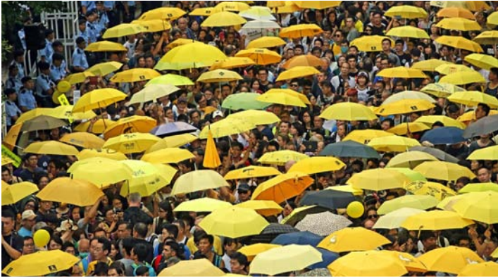
〈그림 3〉 홍콩시위에 사용된 노란우산