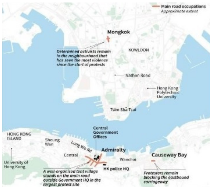
<그림 4> 홍콩시위 발생 지점

이들은 아래 <그림 4>처럼 몽콕(Mongkok, 旺角), 어드미럴티 (Admiralty, 金鐘)역, 코즈웨이베이(Causeway Bay, 銅鑼灣)를 분산 점거하며 시위를 벌였다(Ho 2014, 11852).