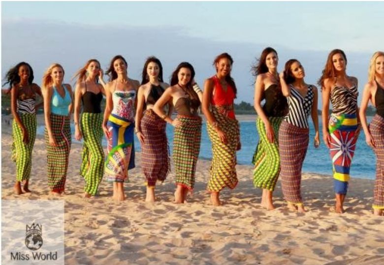
〈그림 1〉 비키니 대신 사롱을 입은 미스월드 참가자들