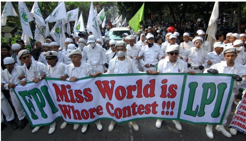
〈그림 2〉 미스월드 반대시위

동시다발적 시위가 인도네시아 전역에서 발생하고 있는 와중에 FPI는 자신들의 트레이드마크를 꺼내 들어서, 동부자바의 반유왕이(Banyuwangi) 및 롬복(Lombok)섬에서 발리로 입항하여 대회를 무산시키겠다는 계획을 발표했다. FPI 대변인은 순교할 준비가 된 오